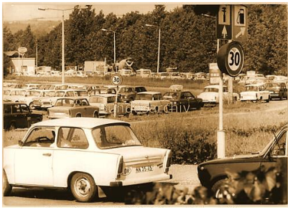
Schnell noch einmal für DDR-Mark tanken: Warteschlange in Gera, 27. Juni 1990

1. Juli 1990 – Deutsche Erinnerungstage: Die Wirtschafts-, Währungs- und Sozialunion als Schrittmacher der deutschen Einheit