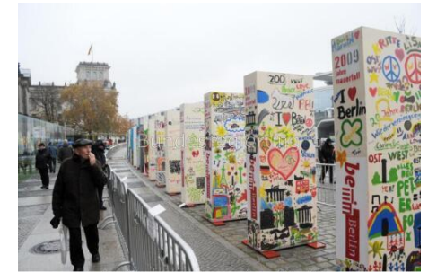
9.11.2009: Dominosteine erinnern an den Fall der Mauer vor 20 Jahren