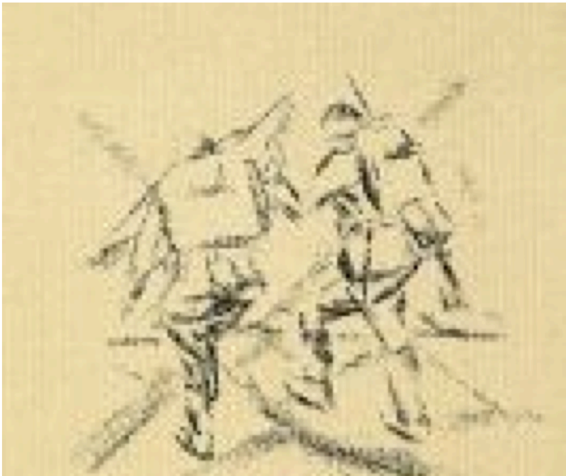
Josef Albers: Zwei Soldaten mit Marschgepäck (1915)

(Vortrag im Ruhr-Museum Essen am 1. Juli 2014)